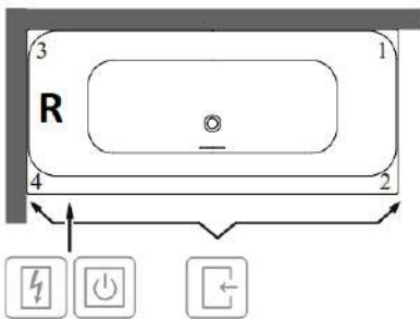
Technik Position 1